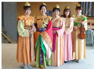
【万葉衣装 イメージ】

時 間：10月 9日（土） ①12：00～12：20 ②15：00～15：20 10月10日（日） ①13：30～13：50 ②16：00～16：20 内 容：万葉衣装をまとい、聖徳太子、蘇我入鹿、推古天皇を模した3名のアクターたちが公園内でグリーティングを行い、来場者との記念撮影も実施します。