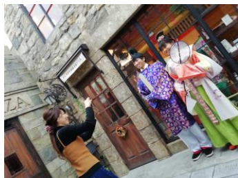
【万葉衣装体験 イメージ】