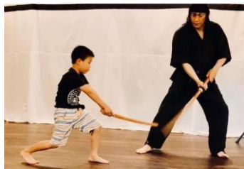
【殺陣体験 イメージ】