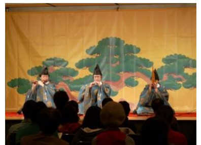
【10日】雅楽演奏 イメージ