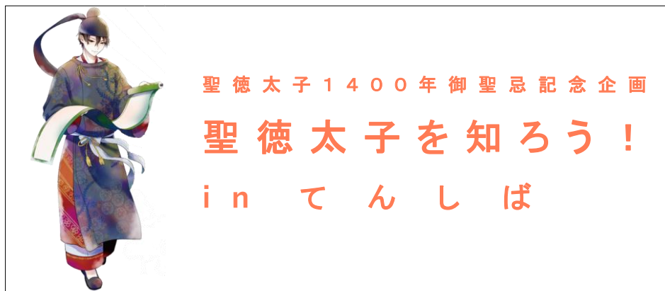
【「聖徳太子を知ろう！ in てんしば」 イメージ】