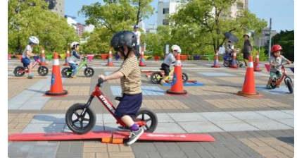
【縁日イベント イメージ】