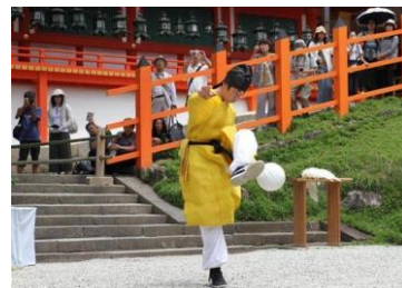
【けまり体験 イメージ】