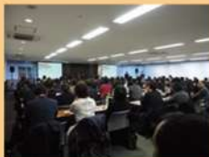
実際のセミナーの様子

観光のLGBTQ施策スペシャリストによるLGBTQセミナーです。第一部をLGBTQ基礎知識、第二部をLGBTQツーリズム・マーケティングとする二部構成のセミナー(2時間目安)を実施し、優良顧客であるLGBTQに関する理解を深め、旅行者のニーズの把握やPR方法などマーケティングの詳細、適切な接遇の仕方などを、きめ細かく学んでいただけます。