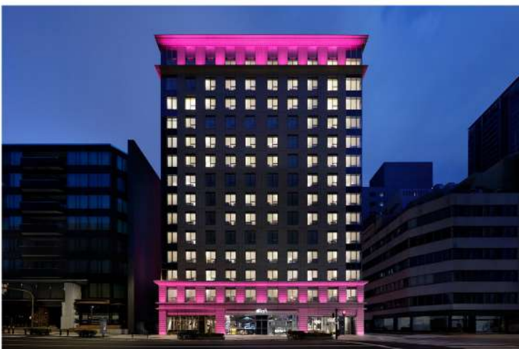
アロフト大阪堂島